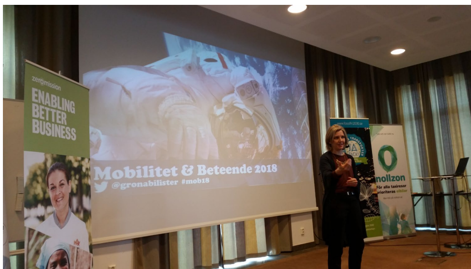
Dåvarande miljöminister Karolina Skog (Mp) besökte Mobilitet och Beteende i Eskilstuna.

Konferensen genomfördes i Eskilstuna med ett 100-tal deltagare. Konferensen resulterade i att Gröna Bilisters Färdplan 2030 uppdaterades, se www.fardplan2030.se . Vi fick god feedback i vår utvärderingsenkät.