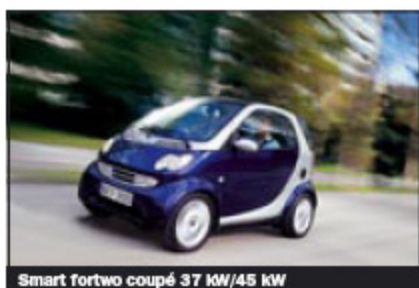
Smart fortwo coupé 37 kW/45 kW

Bland minibilarna finns några av de snålaste bensinbilarna på marknaden. Observera att det i småbilsklassen finns lika snåla bilar, men med större utrymmen.