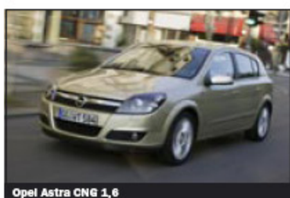
Opel Astra CNG 1,6

Bästa bensindrivna bil i klassen är den nya Mitsubishi Colt 1,1.