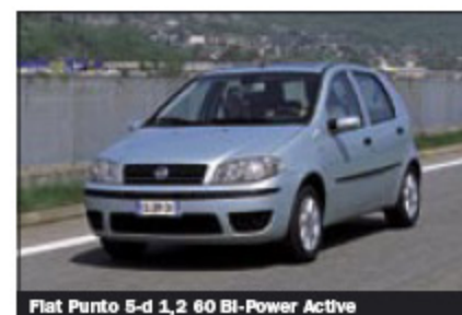
Fiat Punto 5-d 1,2 60 Bi-Power Active

Vinnaren i småbilsklassen är tillika miljöbästa bil i alla kategorier, Fiat Punto Bi-Power i biogasdrift. Även om bilen drivs med naturgas tillhör den de bästa i klassen, men utsläppen av fossilt koldioxid ökar markant. Fiaten är den